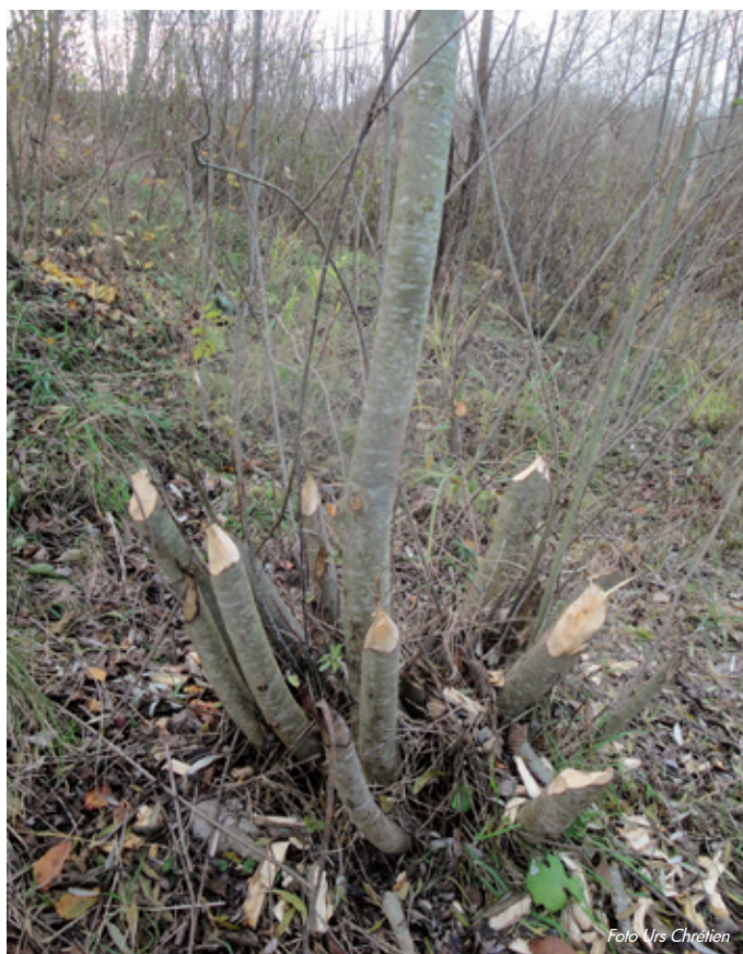
Der Biber hat auch seinen Platz bei der Jungwuchspflege.

Pro Natura wehrt sich aber dezidiert gegen die Forderung nach mehr und grösseren Nadelholzaufforstungen, welche vor allem aus Holzwirtschaftskreisen wieder lauter formuliert wird. Unsere Wälder sollen auch mit der gezielten Förderung von anderen Baumarten im Grundsatz Buchenwälder bleiben. Der naturnahe Waldbau, wie er seit Jahrzehnten bei uns betrieben wird, ist ein breit akzeptiertes Erfolgsmodell, welche sich auf lange Sicht ökologisch und ökonomisch lohnen wird. Urs Chrétien