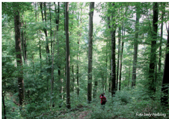
Buchenurwald Uholka-Shyrokyi Luh im Südwesten der Ukraine.

Ein zweites Ziel der Waldpflege ist die Änderung der natürlichen Artenzusammensetzung. Sowohl aus forstlicher wie auch aus naturschützerischer Sicht sind wir nicht wirklich immer zufrieden mit der Dominanz der Buche in unseren Breiten. Ökologisch wertvolle Wälder wie der Allschwiler Wald oder der Hardwald in Muttenz sind das Resultat einer seit Jahrhunderten betriebenen Waldpflege, die besonders in der Jungwaldphase intensiv und aufwändig ist. Schöne grosse Eichen gäbe es ohne intensive Jungwaldpflege kaum – die Eichen wären vor allem auf trockene und warme Standorte beschränkt, wo die