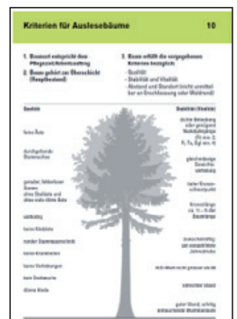
Die Grafik zeigt, welche Kriterien ein Auslesebaum zu erfüllen hat (Quelle: CODOC, 2007).

Im Jungwuchsstadium, das sind junge Bäume bis zu einer Höhe von 1,5 Metern, pflegt der Forstwart den Bestand, indem er alles entfernt, was der Entwicklung der Bäume hinderlich ist. Er regelt die Art, den Grad und die Form der Mischung und sorgt für genügend Platz, um einen qualitativ wertvollen Bestand zu erhalten. Im nachfolgenden Dickungsstadium werden die Jungbäume zum Teil noch von Kletterpflanzen und Sträuchern bedrängt. Die Konkurrenz unter den einzelnen Bäumen verstärkt sich. In diesem Stadium ist es der letzte Zeitpunkt, an dem eine entscheidende Beeinflussung der Mischung (Art, Grad und Form) möglich ist. Das Hauptziel der Dickungspflege ist demnach die Mischung zu regulieren. Das Wachstum soll auf die