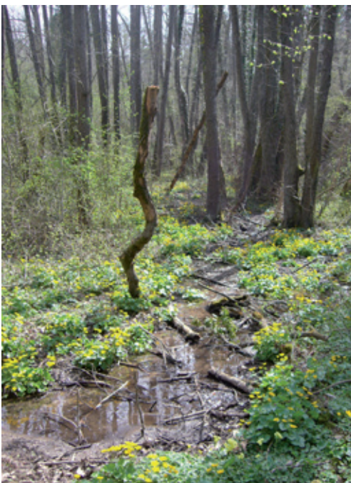
Die Jungwuchspflege orientiert sich immer auch stark an dem, wie die Natur vorgeht.

Eine häufig von Lernenden gestellte Frage ist, ob man in der Jungwaldpflege etwas falsch machen kann? Dies ist immer eine Definitionssache. Sicherlich wird mit der Jungwaldpflege der zukünftige Bestand festgelegt, in dem die gewünschten Baumarten gezielt gefördert werden. Ganz wichtig scheint mir zu sein, dass die gefällten Entscheidungen stets begründbar sind. Ebenso wichtig ist es, dass die Lernenden bei einem Pflegeeingriff Entscheidungen treffen. So ist es zum Beispiel nicht immer einfach, zwischen zwei schönen Ausleseebäumen einen auszuwählen und den anderen zu entfernen. Dasselbe gilt auch beim Freistellen von Ausleseebäumen. Wenn man nicht sicher ist, sollte man immer einen Eingriff machen. Daher bin ich überzeugt, dass der grösste Fehler ist, wenn man nichts macht.