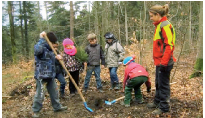
Kindern und Jugendlichen den Wald näher bringen.

Die Initianten möchten den Kindern und Jugendlichen aufzeigen, welche Aufgaben der Lebensraum Wald erfüllt und bieten ihnen in Begleitung von Fachpersonen abwechslungsreiche und spannende Einblicke. Die BLKB unterstützt das Projekt über die nächsten fünf Jahre als Hauptsponsorin.