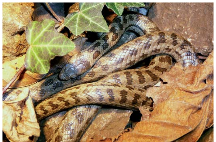
Die Schlingnatter liebt Lichte Wälder.