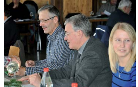
Engagiert an Jubiläums-Jahresversammlung.