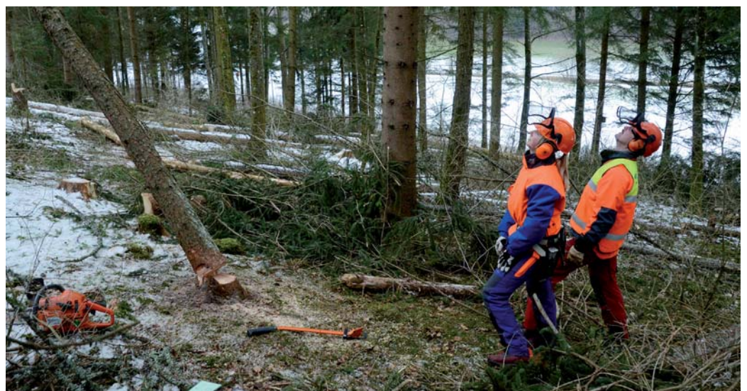
Die Lärche fällt zuerst langsam, dann immer schneller werdend, in die vorgesehene Richtung.

Als jüngste und einzige Frau in den Kursen fühlte ich mich wohl und akzeptiert. Ist es doch nicht so schlimm, nur mit Männern einen Kurs zu absolvieren, wie man an einigen Reaktionen aus dem Bekanntenkreis hätte meinen sollen. Beide Kurse waren für mich wirklich die Erfahrung wert mitzumachen, auch wenn ich jetzt nicht jeden Tag Bäume fällen gehe. Denn ich habe nicht nur ein besseres Verständnis für die resp. von der Waldarbeit gewonnen, vielmehr haben diese sieben Tage bei mir auch prägende Erlebnisse hinterlassen.