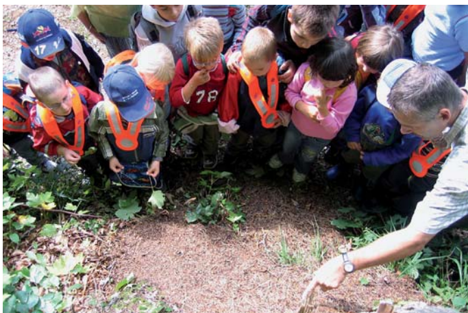
Walderfahrung in der Kindheit prägt das Wald- und Umweltbewusstsein als Erwachsener.

Beat Feigenwinter, Kreisforstingenieur, Amt für Wald beider Basel