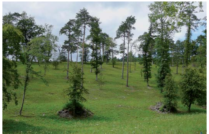
Lichte Wälder sind ideal für Reptilien.

• Von den neu geschaffenen Lichten Wäldern profitierten die Reptilien. So konnte an zwei Orten die seltene und schwierig nachzuweisende Schlingnatter beobachtet werden. Bei den Pflanzen scheint die Wirkung der Auflichtung je nach Standort und den spezifischen Pflege-massnahmen unterschiedlich zu sein. Präzisere Aussagen sind allerdings erst möglich, wenn der komplette Datensatz vorliegt und ausgewertet ist.