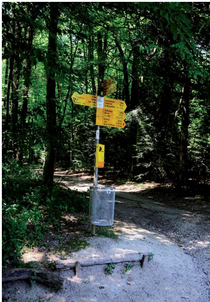
Der Wald wird gerne von Spaziergängern aufgesucht.

Erholung und Freizeit im Wald Beim Thema «Erholungswald» lassen sich im Vergleich mit der